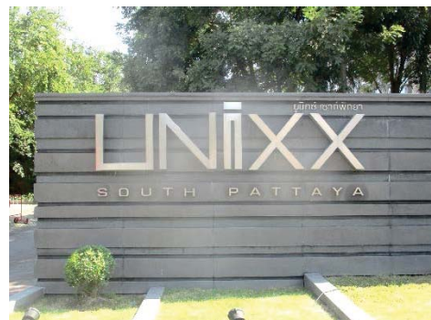
โครงการ ยูนิคซ์ เซาท์พัตยา