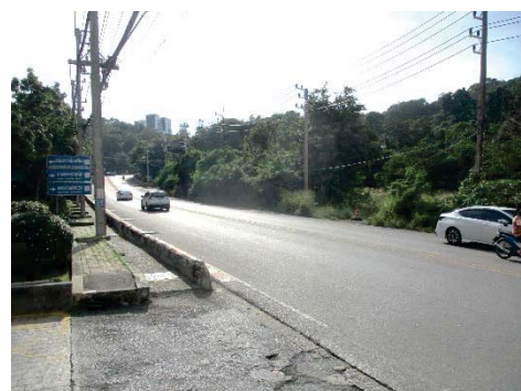
ถนนทัพพระยา