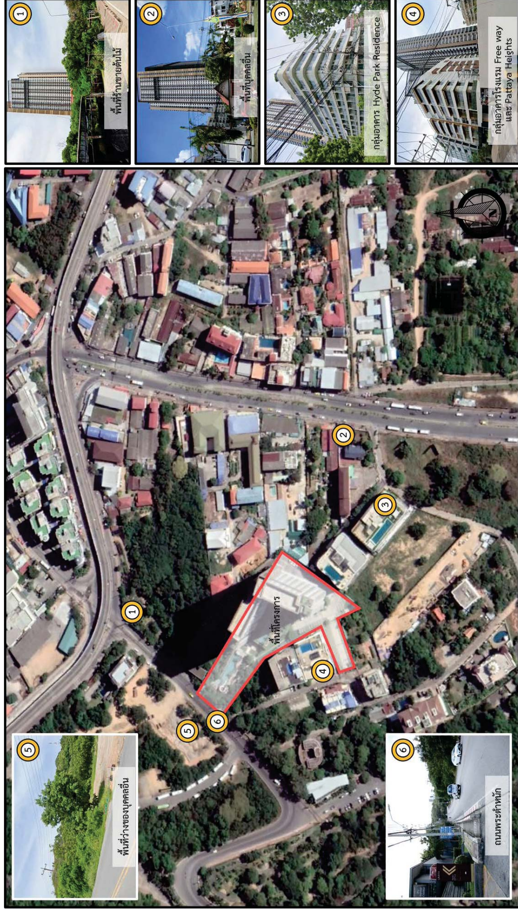
รูปที่ 1-2 การใช้ประโยชน์ที่ดินโดยรอบพื้นที่โครงการ

ที่มา : ดัดแปลงจากภาพถ่ายดาวเทียมโปรแกรม Google Earth, 2020